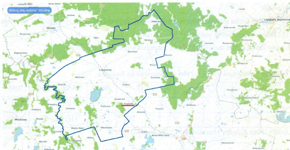
Mapa nr 1. Lokalizacja miejscowości Rogiedle