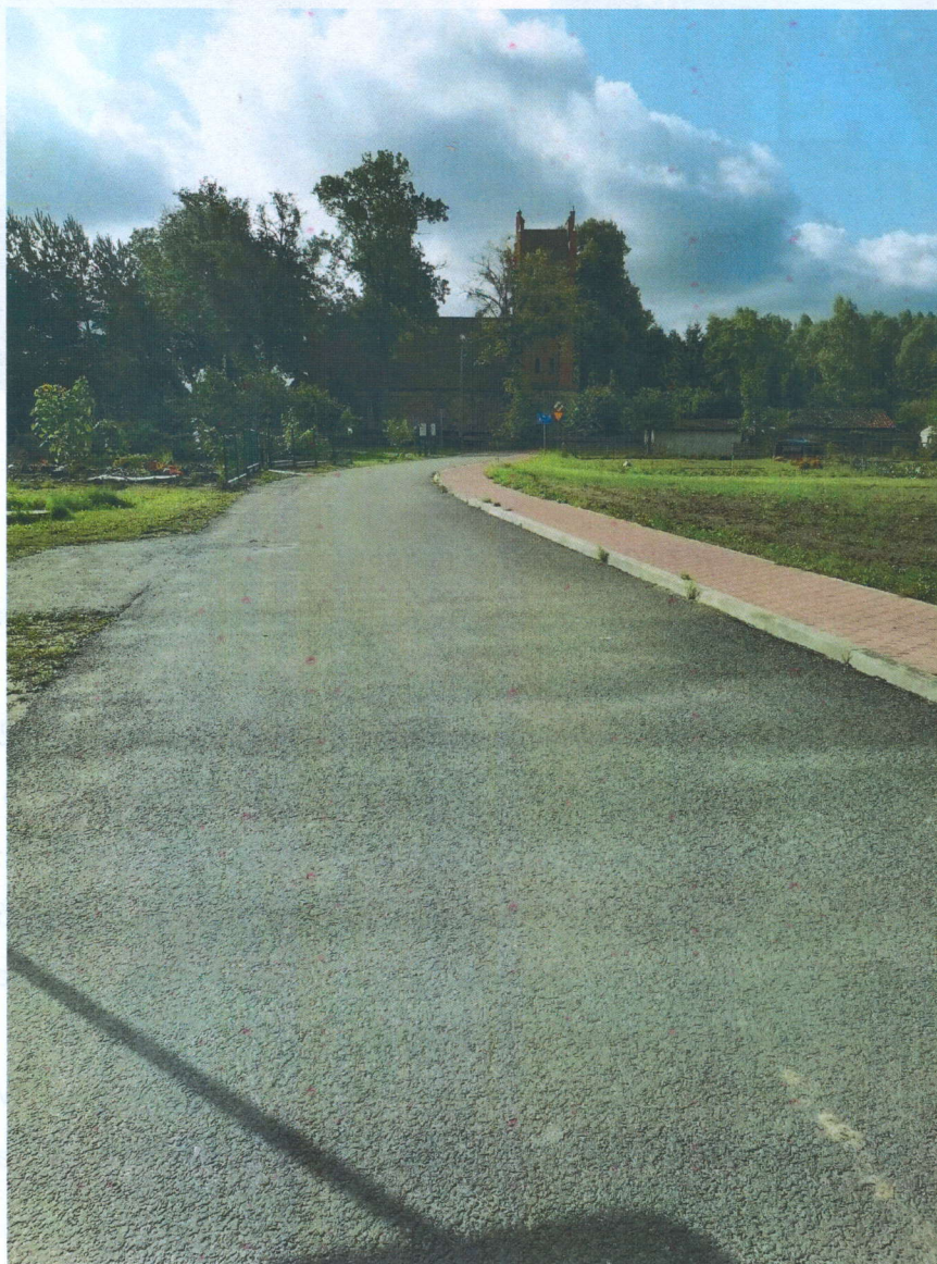
Zdjęcie nr 2. Droga gminna w Rogiedlach

Gmina Lubomino w 2021 r. zrealizowała inwestycję polegającą na przebudowie drogi wewnętrznej na drogę gminną w miejscowości Rogiedle, przebiegającą przez centrum zwartej zabudowy wsi, poprzez wykonanie jezdni o nawierzchni bitumicznej oraz ciągu pieszo-jezdnego. Regularnym remontom poddawana jest droga gminna publiczna nr 116032 N oraz drogi gminne wewnętrzne. Pomimo starań drogi gruntowe w okresie jesienno - zimowym i zimowo - wiosennym ze względu na warunki atmosferyczne są w złym stanie, a znikoma ilość w stanie średnim. Stan dróg w znacznym stopniu przyczynia się do zmniejszenia aktywizacji społecznej i zawodowej mieszkańców oraz zmniejsza szanse na podjęcie zatrudnienia.