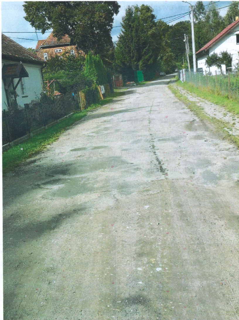
Zdjęcie nr 3. Droga powiatowa